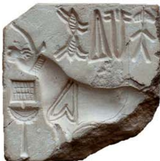
モヘンジョダロ出土印章 (Corpus of Indus Seals and Inscriptions No. M-802)

どなたでも参加できます。 直接会場にお越しください。 http://rcwasia.hass.tsukuba.ac.jp